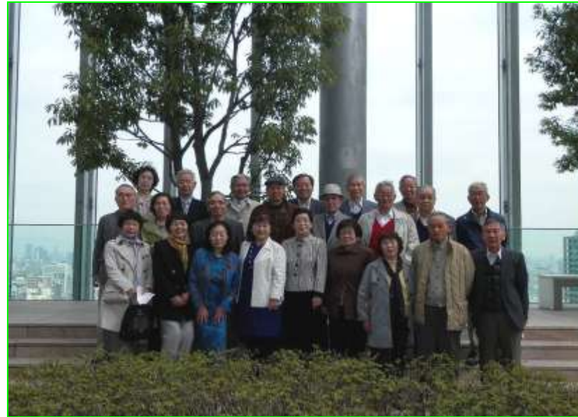
あべのハルカス 16階 屋上庭園にて