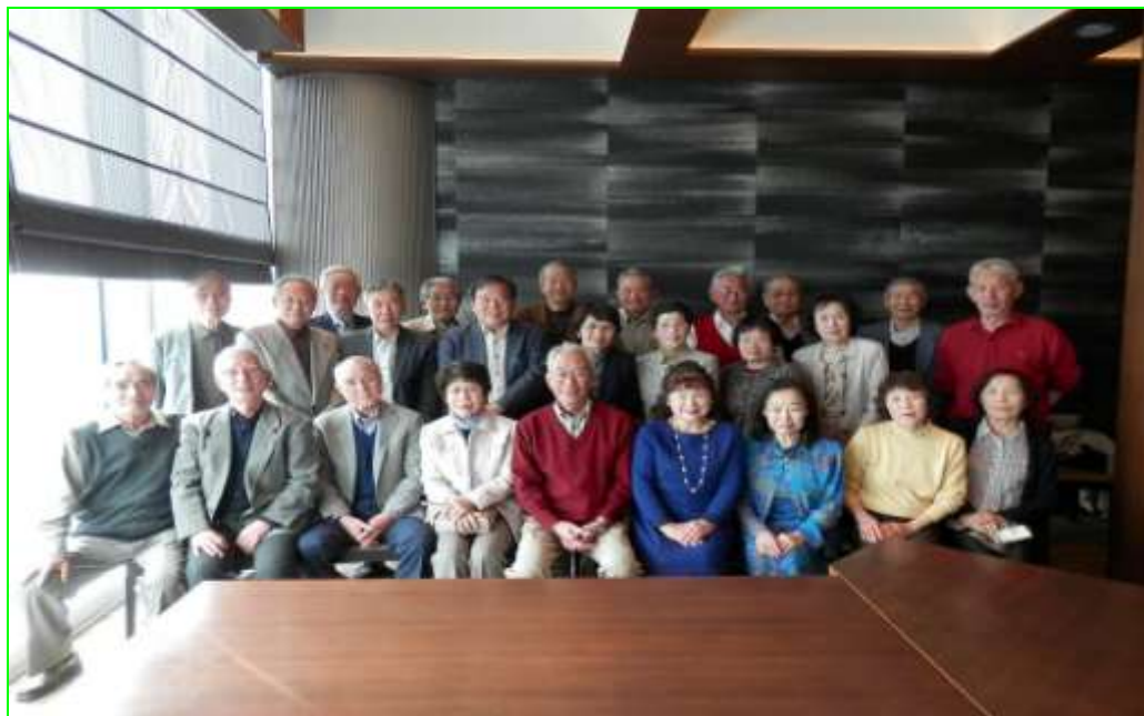
大阪マリオット都ホテル レストランZ K(ジーケー) 57階にて