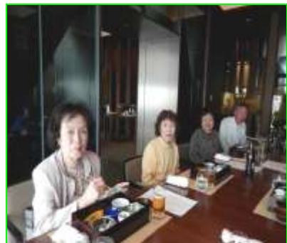
まさに“天空”という言葉にふさわしい約270mの高さに位置する新しい美観のレストラン。 関西観八会はその“天空”の空間を楽しみながら上質な歓談のひとときを過ごしました。