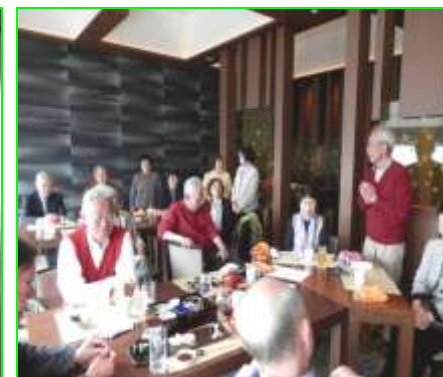
三宅会長のご挨拶